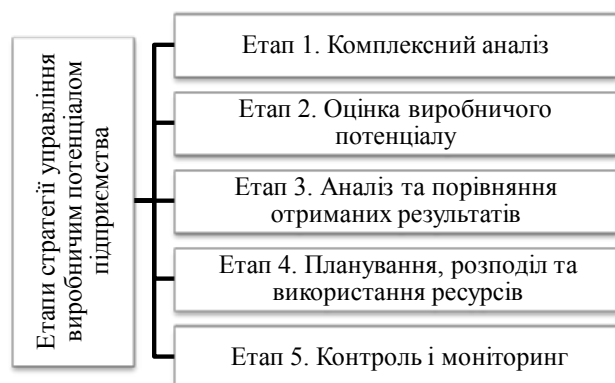
Рис. 1. Етапи стратегії управління виробничим потенціалом підприємства

Управління виробничим потенціалом варто розглядати як конкретну функцію менеджменту, виконання якої слід здійснювати в такій логічній послідовності: планування виробничої програми; організування роботи служб та підрозділів з метою виконання поставлених завдань; мотивування суб'єктів, які безпосередньо чи побічно впливають на виробничий процес; контролювання рівня якості виготовленої продукції та виконання виробничої програми загалом; регулювання виявлених проблем та недоліків [6, с. 66]. Ефективність управління виробничим потенціалом полягає в оптимальності його використання, для чого необхідно сформулювати стратегію управління виробничим потенціалом підприємства, яка складається з етапів, представлених на рис. 1.