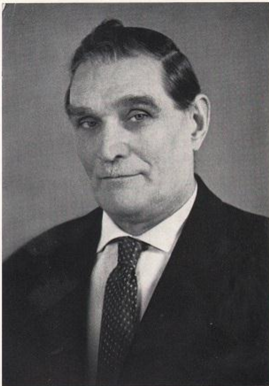
Проф. д-р Петро Курінний.