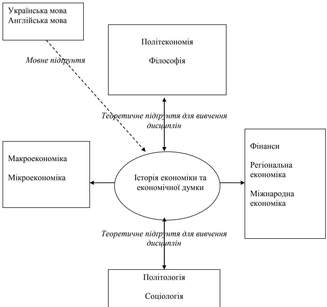
Рис. 1. Структурно-логічний зв'язок з іншими дисциплінами