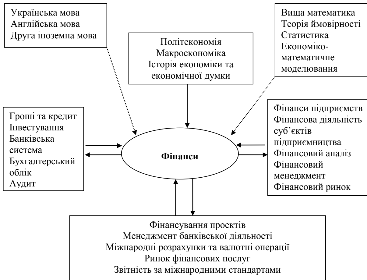
Рис. 1. Структурно-логічний зв'язок з іншими дисциплінами

Місце дисципліни в структурно-логічній схемі підготовки бакалаврів (див. рис. 1).