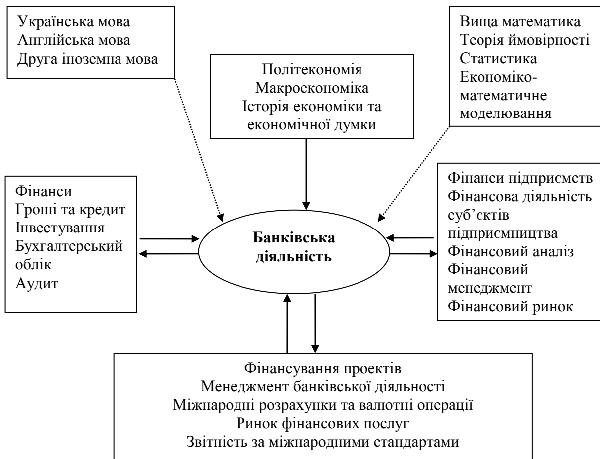
Рис. 1. Структурно-логічний зв'язок з іншими дисциплінами

Місце дисципліни в структурно-логічній схемі підготовки бакалаврів (див. рис. 1).