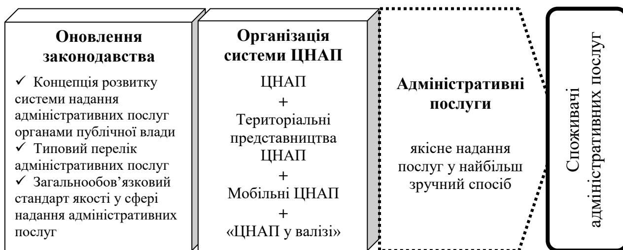
Рис. 2 Організаційно-правовий компонент вдосконалення механізму надання адміністративних послуг

Загальна характеристика організаційно-правового компоненту вдосконалення механізму надання адміністративних послуг може бути зображена наступним чином (рис. 2).