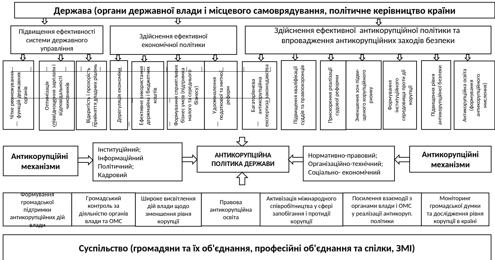
Рис. 1. Модель формування антикорупційної політики держави