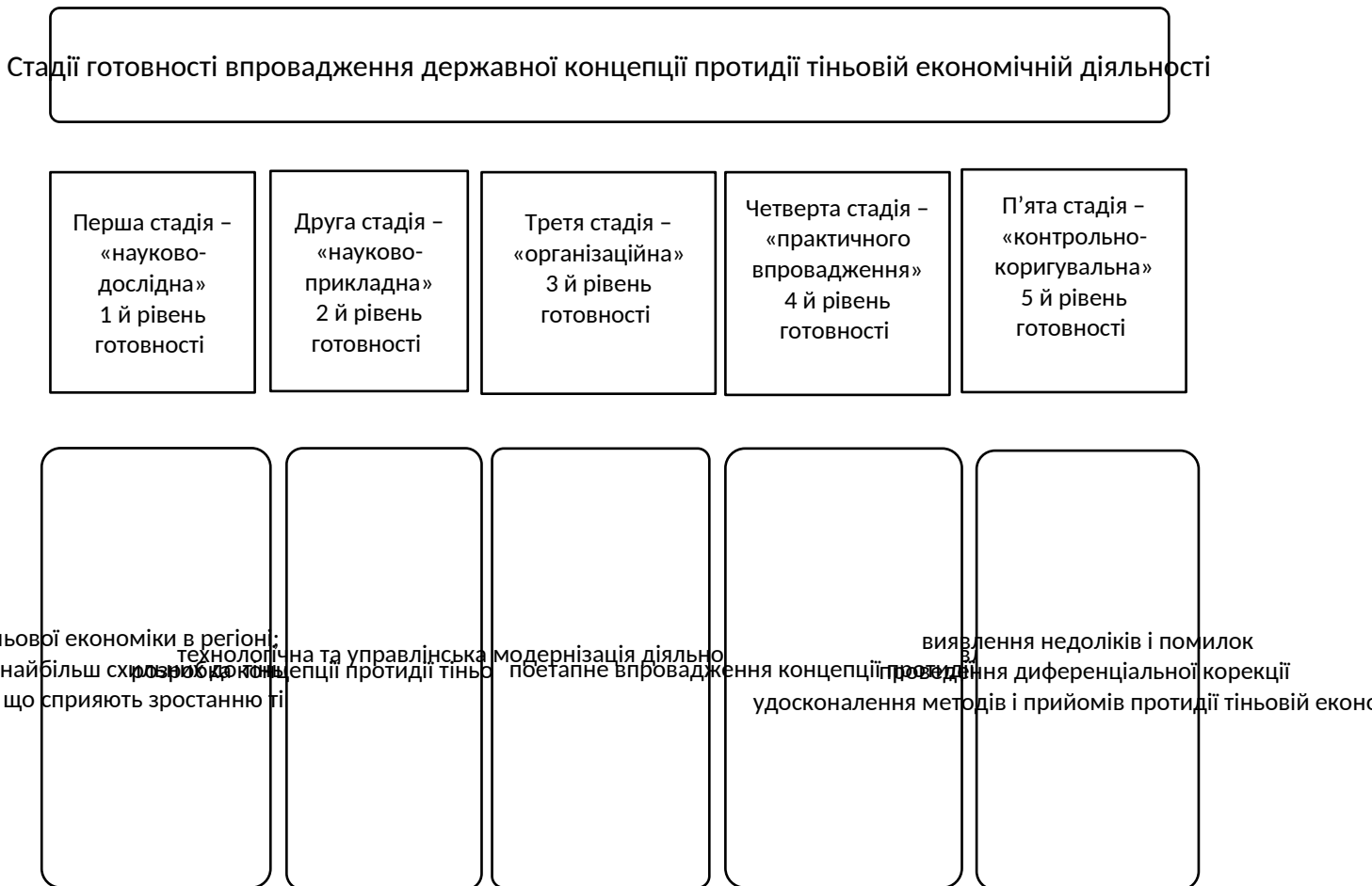
Рис.2 Етапи впровадження державної концепції протидії тіншовій економічній діяльності

Широкомасштабна тінізація економічних відносин в Україні, їх вкоріненість у соціум та національну культуру зумовлює масове порушення принципу верховенства права, створює макроекономічні диспропорції та структурні деформації в суспільно–економічному розвитку, що призводить до виникнення загроз національним інтересам країни й національній безпеці в економічній сфері. Це зумовлює об'єктивну необхідність розробки концепції протидії тіншовій економічній діяльності та відповідної реалізації шляхів і способів детінізації економіки, пріоритетом якої є прискорення економічного розвитку країни, покращення бізнес–середовища, виявлення резервів поповнення бюджетних коштів та запобігання маргіналізації всієї соціально–економічної структури суспільства ( рис. 3).