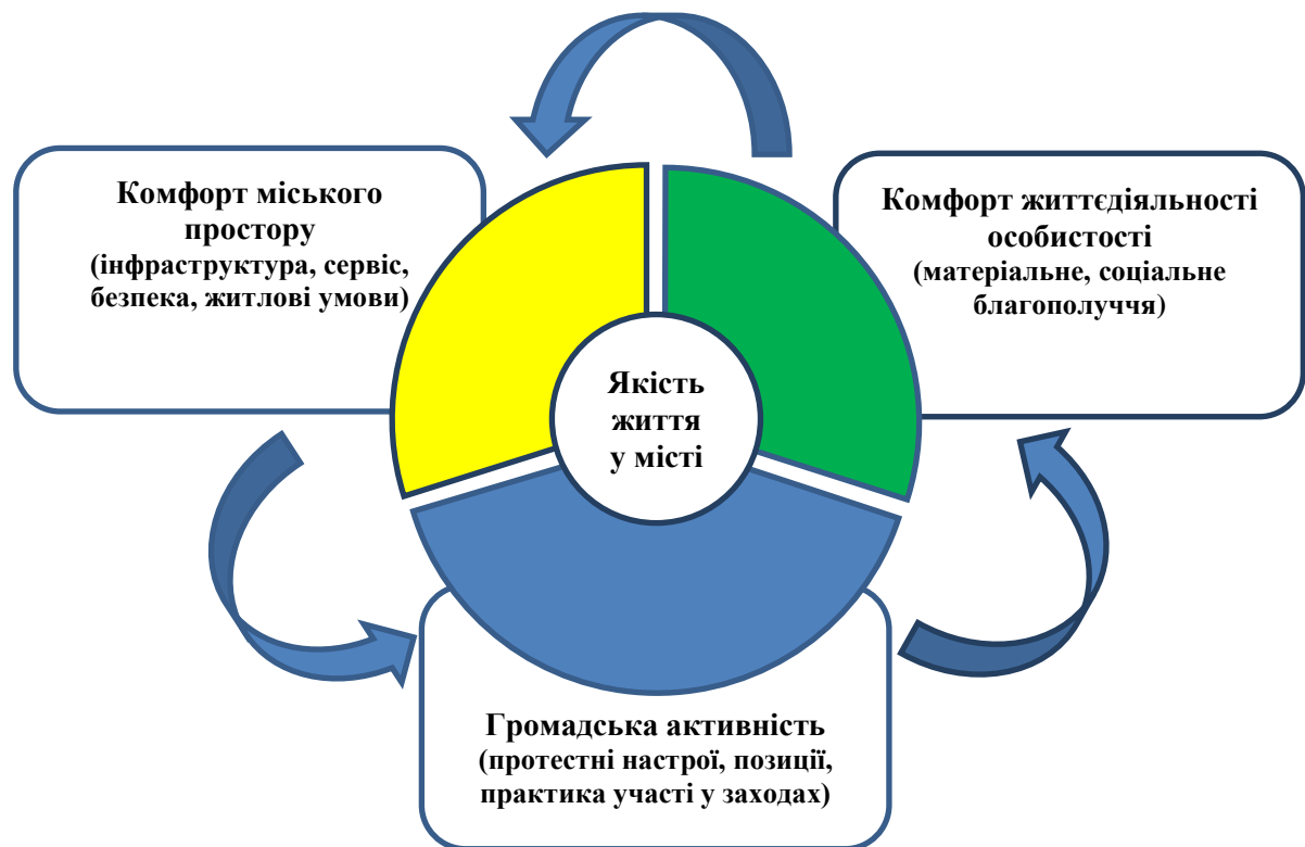
Рис. 1.1. Методологічні засади вивчення якості життя у місті

Перший компонент складається із загальної задоволеності життям і оцінок ступеня задоволеності його різними сторонами (інфраструктура, сервіс, житлові умови), другий - являє собою баланс позитивних й негативних емоцій щодо рівня матеріального й соціального благополуччя 2 . Поєднати зазначені елементи можна за допомогою визначення рівня громадянської активності містян, їх позицій щодо необхідності та бажання зміни реальної соціальної ситуації у місті на краще.