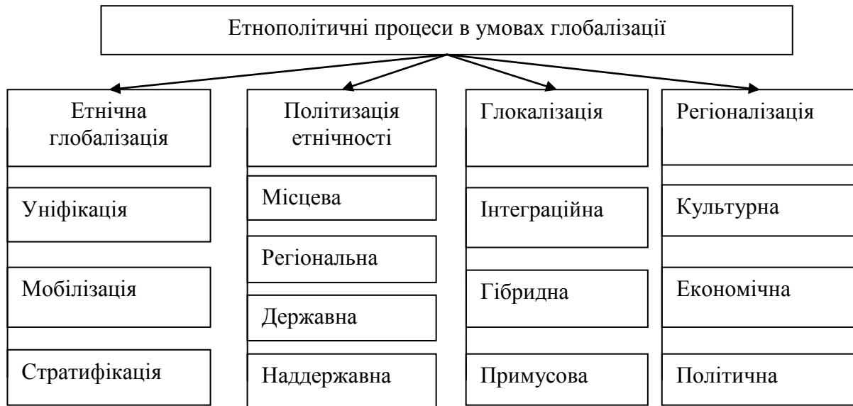
Рис. 1. Типологія етнополітичних процесів в умовах глобалізації

етнополітичних процесів не обмежується діяльністю держави та її інститутів, тому що до них залучаються такі структури, як політичні партії, етноорганізації тощо; формування та реалізації державного управління й регулювання у галузі міжетнічних відносин зумовлено саме розвитком етноструктур та їх інститутів.