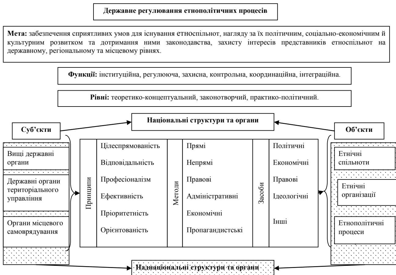
Рис. 2. Механізм державного регулювання етнополітичних процесів

Ефективна реалізація зазначеної мети передбачає виконання даним механізмом комплексу функцій, які становлять сутність його функціонального призначення, а саме: інституційної, регулюючої, захисної, контрольної, координаційної, інтеграційної. Зважаючи на складність механізму державного регулювання етнополітичних процесів, існує три рівні такого регулювання. Перший – теоретико-концептуальний. На ньому формуються концепція національної політики, програми етнічного розвитку. Це прерогатива науково-дослідних інститутів, вузівських наукових підрозділів, дослідницьких центрів, експертних груп. Другий – законотворчий. Тут приймають законоположення, рішення, акти та встановлення, що визначають конкретні механізми, шляхи і засоби вирішення поставлених завдань. Це відповідальність вищих державних органів влади. Концепція етнополітики також визначається цими органами – в її головних, істотних рисах. Третій – практико-політичний. Це компетенція органів регіонів, адміністративно-територіальних одиниць. Тут втілюються програми з урахуванням специфіки регіонів. Оптимальне поєднання всіх рівнів забезпечить стабільну етнополітичну ситуацію та ефективне державне регулювання в будь-якій країні. Важливе місце у процесі формування механізму державного регулювання етнополітичними процесами, посідають елементи, які забезпечують цільовий вплив на об'єкти – принципи, методи, засоби. Провідна роль в цьому процесі належить принципам державного