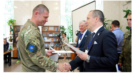
Церемонія вручення сертифікатів

Ще одна подія симпозиуму – урочисте вручення міжнародних сертифікатів про навчання груп вій-