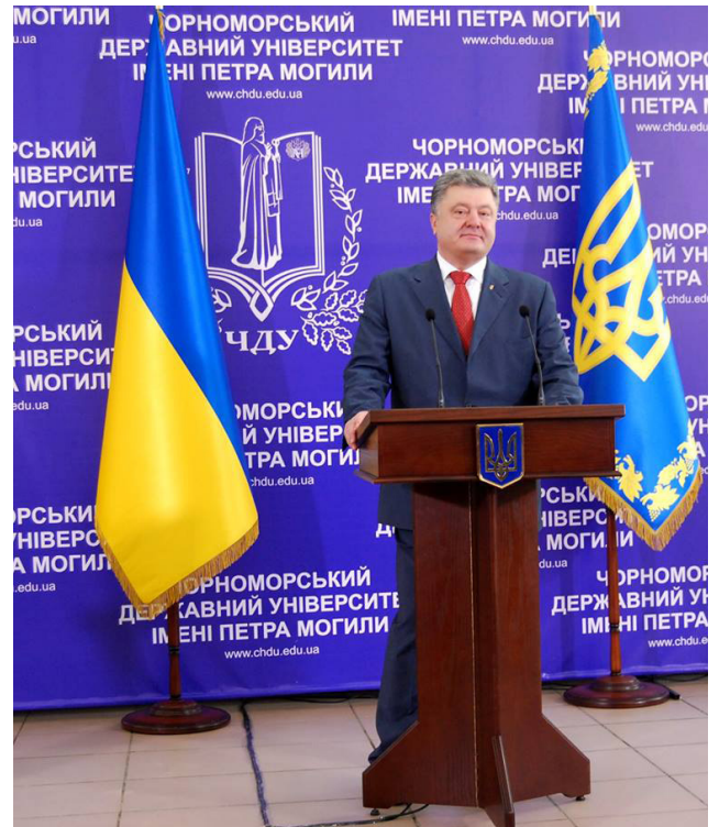
На фото: Президент України Петро Порошенко

Чорноморський державний університет імені Петра Могили отримав статус національного. Із цієї подією колектив університету і його студентів привітав Президент України Петро Порошенко під час свого візиту на Миколаївщину. Робочий візит Президента України розпочався з відкриття нового терміналу компанії «Bunge-Україна», в якому також взяв участь заступник міністра сільськогосподарства США. Петро Порошенко підкреслив, що реалізація такого масштабного інвестиційного проекту – «голосування» за Україну грошима, це створення нових робочих місць, це – додаткові податки, наповнення місцевих бюджетів і підняття престижу країни. Виробничо-перевантажувальний комплекс «Bunge» – це сучасні завод і термінали із прийняття сировини і відвантаження готової продукції, унікальне підприємство, яке є надсучасним і відповідає