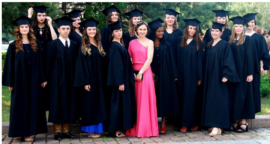
На фото: новоспечені бакалаври та магістри

Тепер за багатьма з цих молодих людей вибір: починати своє доросле, незалежне від дзвінків і балів життя чи продовжувати навчання на магістратурі. З кожним днем в університеті таких можливостей