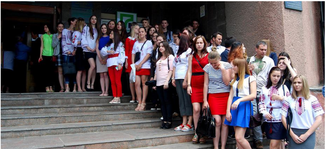
На фото: студенти ЧНУ ім. Петра Могили

Слава Україні! Героям слава! – пролунало в читальній залі Чорноморського національного університету імені Петра Могили. Працівники навчального закладу і його студенти продовжуватимуть кращі традиції свого університету, який має не таку довгу, але надзвичайно яскраву історію. Віват, університете!!