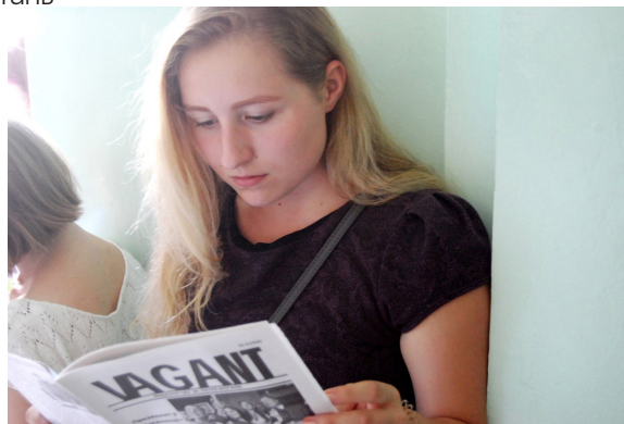
Перше знайомство зі студентською газетою

університет посів 5 місце. До речі, Могилянка – єдиний миколаївський університет, який увійшов до цього рейтингу. Також наш університет визнано найкращим у Миколаєві.