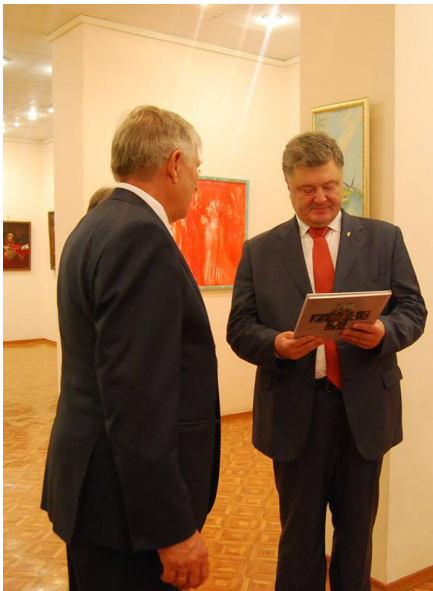
На фото: Петро Порошенко в галереї мистецтв університету

Біля університету Гаранта зустрічала студентська молодь. На згадку – селфі з Президентом! Петро Олексійович не відмовляє: він прихильно ставиться до сучасної активної молоді. В самому університеті Порошенко найперше відвідав Галерею мистецтв, у якій познайомився ближче з творчістю народного художника України Андрія Антоюка, отримав у подарунок альбом з його репродукціями. Далі відбулася зустріч із викладачами, працівниками і студентами миколаївської Могилянки. Петро Порошенко підкреслив, що надзвичайно цінує активну громадянську позицію, високий професіоналізм, наукову діяльність, прагнення до розвитку, волонтерську роботу Чорноморського університету. Наголосив на