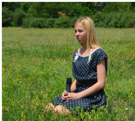
На фото: учасниця флешмобу

100 років тому пішов із життя Іван Франко, поет, прозаїк, драматург, учений, етнограф, фольклорист, історик, філософ, соціолог, економіст, журналіст, перекладач, громадсько-політичний діяч, один із найвидатніших просвітителів українського народу. Його творчість мала і досі має неосяжний вплив на українців. Його перу належить кілька тисяч творів загальним обсягом понад 100 томів, що, до речі, б'є рекорд всесвітньо відомого Льва Толстого (його «рекорд» – 90 томів). Іван Франко – Каменяр – скромно казав сам про себе: «І сам я в усій своїй діяльності бажав бути не поетом, не вченим, не публіцистом, а поперед усього чоловіком. Се було власне випливом мого бажання — бути чоловіком, освіченим чоловіком, не лишатися чужим у жаднім таким питанні, що