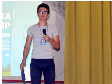
На фото: тренер IT-кемпу

Першого дня лектори пояснювали концепції стартапів у дуже невимушеній атмосфері, під час якої всі могли насолодитися музичними паузами та смаколикami. Наприкін-