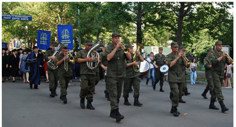
На фото: військовий духовий оркестр