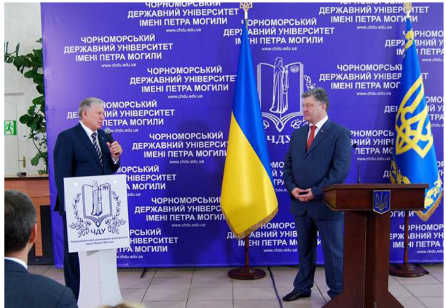
На фото: Леонід Клименко й Петро Порошенко

Подарував на згадку про визнання подію скульптурне зображення Петра Могили. Петро Порошенко зазначив, що відтепер у його робочому кабінеті стоятиме фігура славетного просвітянина і громадського діяча, справжнього патріота і воїна, що являє собою символ України