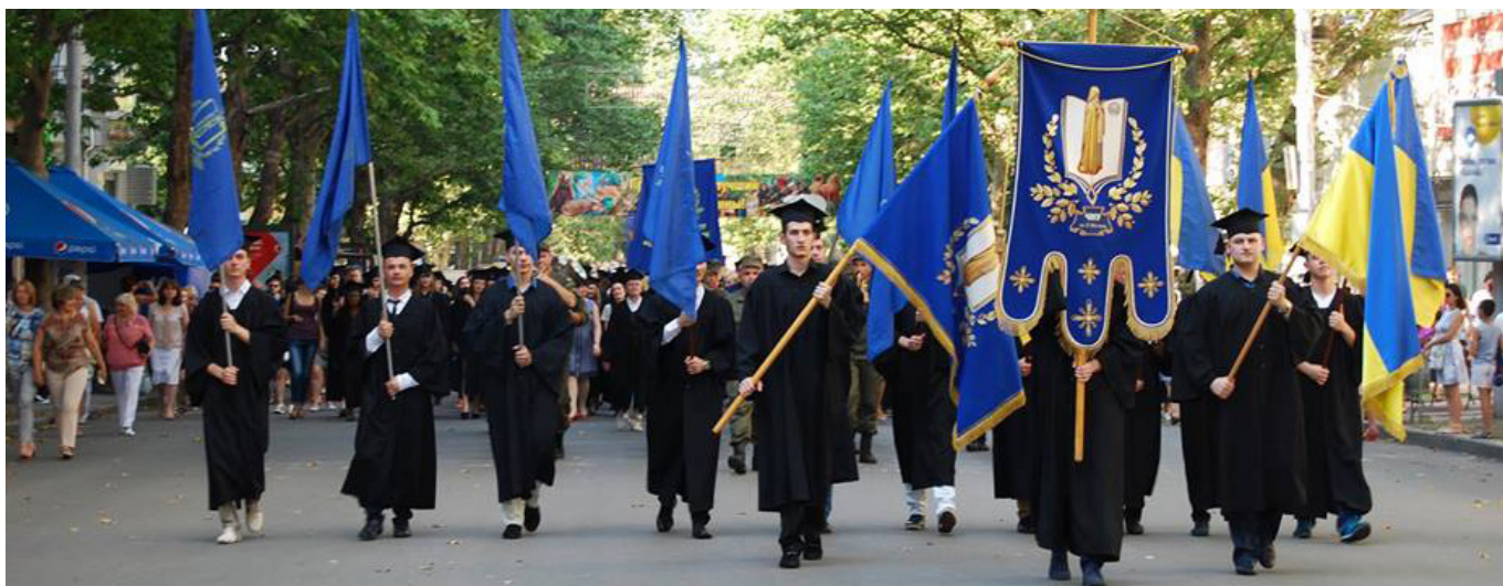
Очолюють ходу хлопці з прапорами та хоругвою університету

Аби всі вони збулися. Головне – із гордістю і гідністю нести по життю звання випускник моголянки. Віват, Академіє!