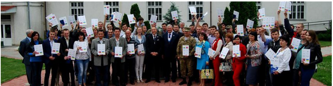
Випускники проекту «Перепідготовка і соціальна адаптація військовослужбовців та членів їхніх сімей в Україні»

ськовослужбовців Збройних сил України, звільнених у запас, в рамках проекту «Україна-Норвегія» на базі Чорноморського державного університету імені Петра Могили за напрямками «Практичний веб-дизайн: проектування, створення та супроводження веб-вузла» та «Підприємництво в сфері фізичної реабілітації та фітнесу». Сертифікати вручали посол Королівства Норвегія в Україні Джон Фредріксен, професор університету «NORD» Анатолій Бурмістров, ректор ЧДУ ім. Петра Могили Леонід Клименко. Документи про освіту отримали понад сімдесят військовослужбовців та членів їхніх сімей. Разом із документами ці люди, які пройшли непросте випробування війною, отримують можливість розпочати нове життя. Досвід такого навчання виявився дуже цікавим. Є вірогідність, що це співробітництво отримає продовження. Принаймні, база для цієї роботи є. Директор Інституту післядипломної освіти Чорноморського державного університету імені Петра Могили Анна Норд запевняє, що такі завдання нам до снаги.