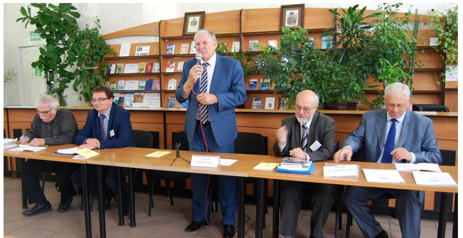
На фото: організатори та гості форуму

У Миколаєві в Чорноморському державному університеті ім. Петра Могили відкрилася Міжнародна наукова конференція «Ольвійський форум – 2016: стратегії країн Причорноморського регіону в геополітичному просторі».