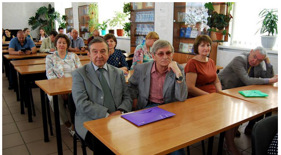
На фото: учасники форуму

Під час урочистого відкриття форуму було підписано кілька договорів, в яких науковці різних країн світу висловили свої наміри щодо подальшої спільної праці і розвиток наукових, освітніх зв'язків.