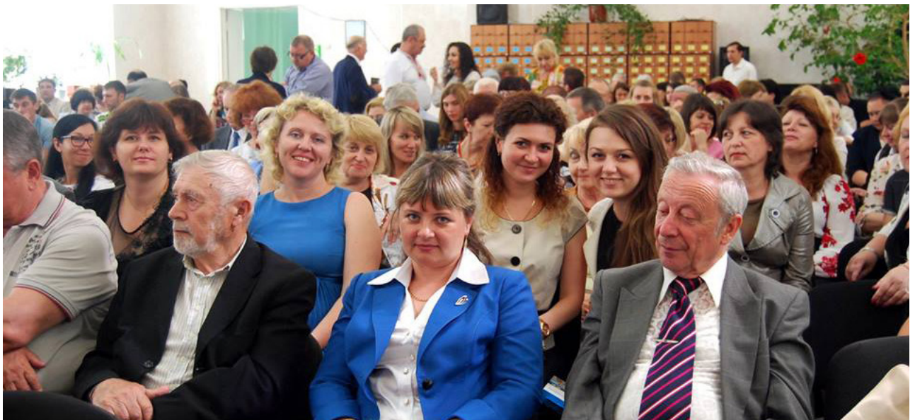
На фото: викладачі та співробітники ЧНУ ім. Петра Могили

всім екологічним і технологічним вимогам часу. Після відкриття терміналу Президент вирушив до Чорноморського державного університету імені Петра Могили. Указ про надання статусу Національного кращому університету області був підписаний тільки 14 червня. А наступного дня Президент особисто повідомив про це.