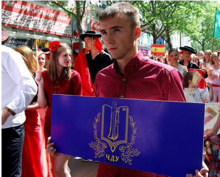
На фото: ЧДУ ім. Петра Могили представляє три країни

Члени журі, до якого входили представники влади, громадські діячі міста, мали оцінити презентацію кожної країни за кількома показниками – хода, презентація і кон-