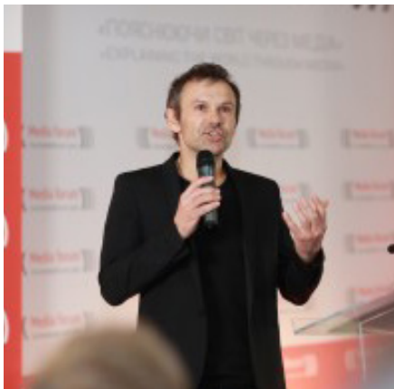
На фото: лідер гурту «Океан Ельзи» Святослав Вакарчук

Святослав Вакарчук пропонує розвивати Українську державу на принципах конституційного патріотизму. Недостатньо кожного дня піднімати прапор та співати гімн України, кожен повинен боротися за абсолютно прості, але такі потрібні речі: чесні суди, відсутність корупції, свободу слова і преси, свободу економічної дії.