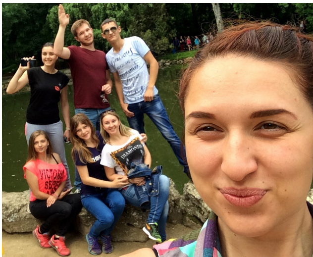
На фото: селфі у заповіднику

місць, де проходять практику наші студенти.