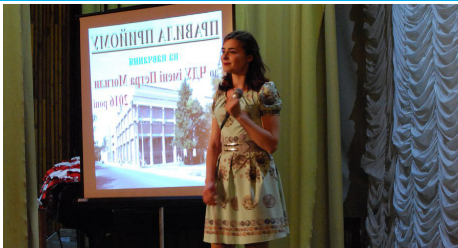
На фото: вокалістка культурно-мистецького центру

Жодне питання не залишилося без уваги. Схвильовані, але рішуче налаштовані абітурієнти слухали уважно і зацікавлено. Формат спілкування був досить невимушеним. Після закінчення багато абітурієнтів підходило