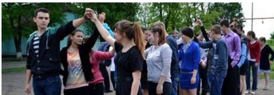
На фото: учні Березківської школи-інтернату

Для дошкільнят та молодших школярів актори лялькового театру