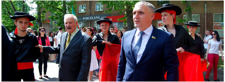
На фото: мер Миколаєва

Після екскурсії університетом делегація зустрілася зі студентами. Кожен охочий мав змогу поставити питання ректорові, меру чи представникам консульств. Переважну більшість студентів цікавила, насамперед, можливість навчан-