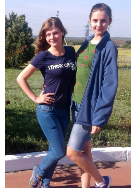
На фото: майбутні екологи

й наразі там, і кожен із відвідувачів може пригостити звірятка травою, а екскурсовод підкаже, який із кущів найбільше їй до смаку. Засновник степового оазису поставив високу природоохоронну планку, яку подолав із запасом як мінімум у сто років, бо і сьогодні заповідник живе в найкращих традиціях Фальц-Фейна.