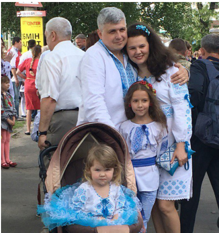
На фото: уся сім'я на параді

21 травня усі охочі у вишитих сорочках і з державною символікою пройшлися центром міста – від Кафедрального собору Касперівської ікони Божої Матері на вулиці Садовій, потім по Нікольській та Соборній до Обласного палацу культури. Як і зазвичай ходу розпочали зі спільного виконання національного гімну України. Під час ходи учасники вигукували патріотичні гасла та співали пісні гурту Океан Ельзи, Ляписа Трубецкого, Олега Скрипки тощо. Вишиті сорочки можна