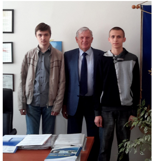
На фото: ректор вітає переможців