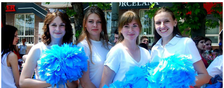
На фото: Португалія = футбол

кидати сміття на вулиці. І варто відзначити, що після ходи, концерту і парадів вишиванок, що відбувся паралельно, Соборна вулиця залишилась чистою. А це означає тільки одне – миколаївці можуть не тільки феєрично відзначити свята, а й дбати про своє місто по-справжньому, що негвинно наближує нас до європейських стандартів.