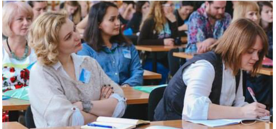
На фото: учасники форуму

Перший досвід проведення конференції такого масштабу засвідчив інтелектуальний та культурний потенціал ЧДУ ім. Петра Могили, відкрив перспективи професійної співпраці різних університетів України, а також виявив неабиякий інтерес до проблеми розвитку й вивчення української мови, культури та історії України.