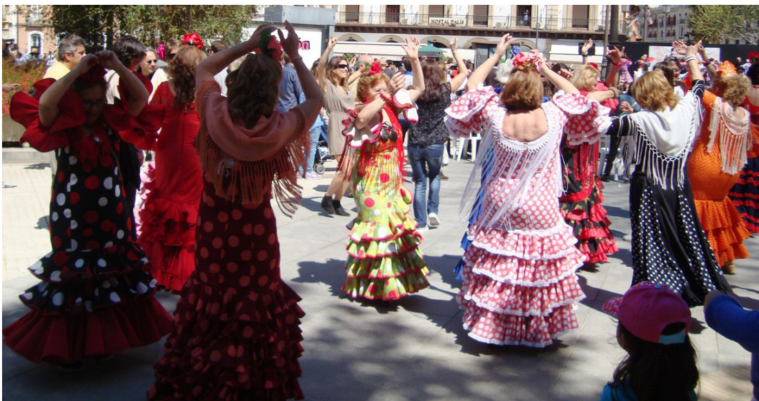
На фото: пристрасне фламенко на вулицях міста

демонстрували різні біблійні сцени. Також це був ідеальний час для подорожі. Мала змогу відвідати з друзями Мадрид, Гранаду, об'їздили Андалусію. В Севільї були двічі. Одного разу побувати там недостатньо. Відвідали її славнозвісну Площу Іспанії з зображеннями найвідоміших іспанських міст. Знайшли наш Кадіс. Зраділи як рідні домівці. Туди власне й повернулися.