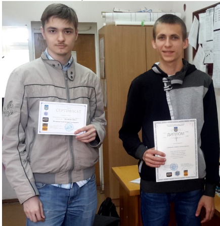
На фото: гордість університету

Олімпіада відбувалася в трьох номінаціях, а саме: категорії «М» (спеціальності, що потребують поглибленого вивчення математики, такі як: прикладна математика,