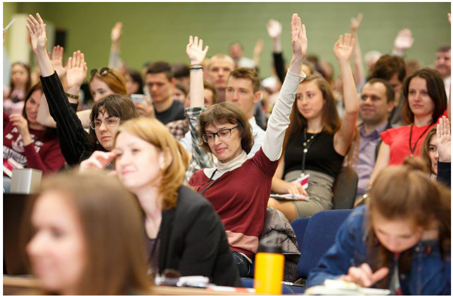
На фото: учасники форуму

Основну увагу музикант приділив ролі кожного окремого громадянина в розвитку України.