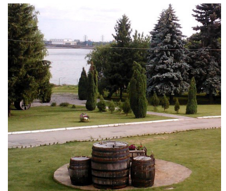
На фото: заповідник приймає гостей

Кожна з наших подорожей унікальна і має свій особливий, незабутній післясмак, і з нетерпінням кожен із нас чекає наступної виїзної лекції. Адже всім приємно вирватися із кам'яних стін та асфальтових доріг і трішки відпочити на природі, а особливо, коли за це ще й оцінки ставлять!