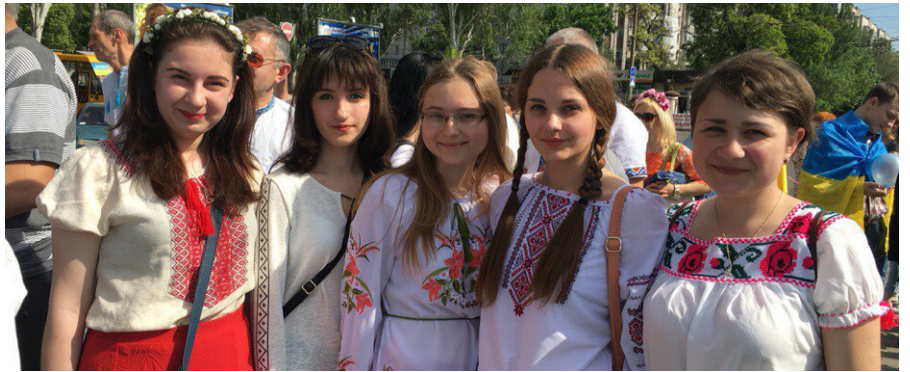
На фото: студенти ЧДУ ім. Петра Могили

було побачити не тільки на жінках і чоловіках, дівчатах і хлопцях, а й на немовлятах і домашніх улюбленцях. Жінки також прикрашали своє волосся вінками та квітами.